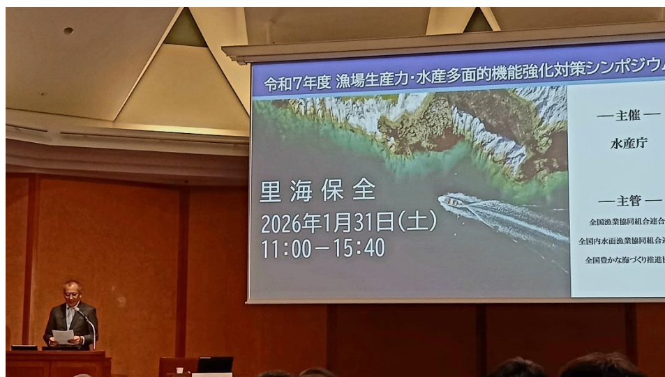
水産庁 中村部長 開会挨拶