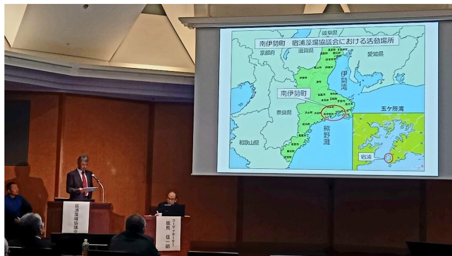
三重県宿浦の取組を紹介