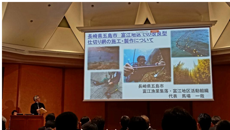
五島漁協富江支所 富江地区集落活動組織の発表の様子