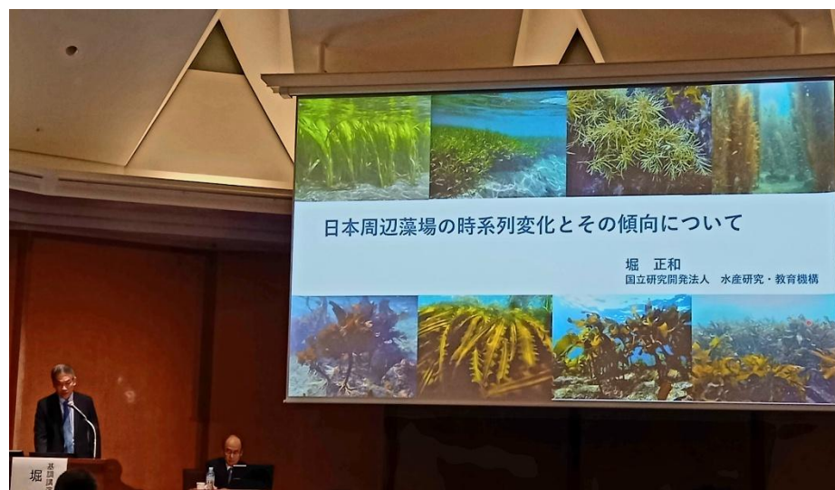
水研機構 堀 正和氏による基調講演