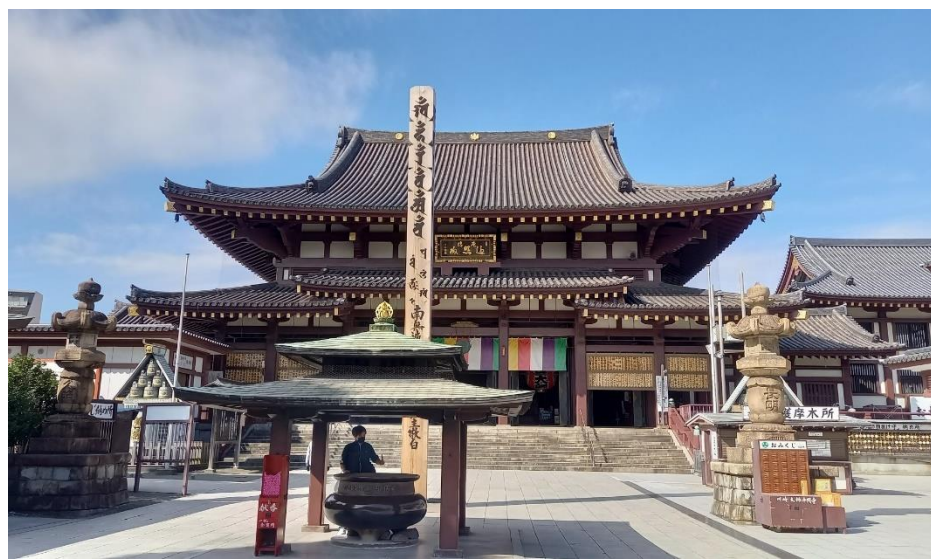
川崎大師で祈願(大本堂)