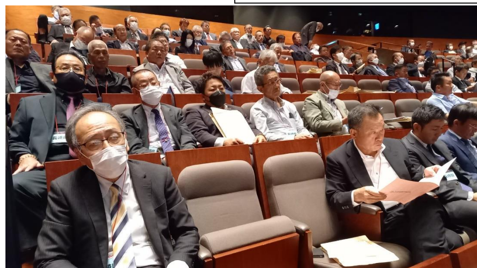
長崎県の座席の様子(当協会、県内漁協関係組合長等)