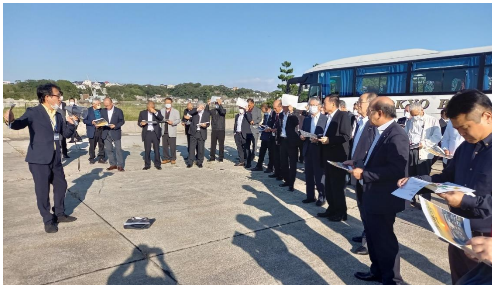
三崎漁港の海業関連視察(三崎市役所の説明)