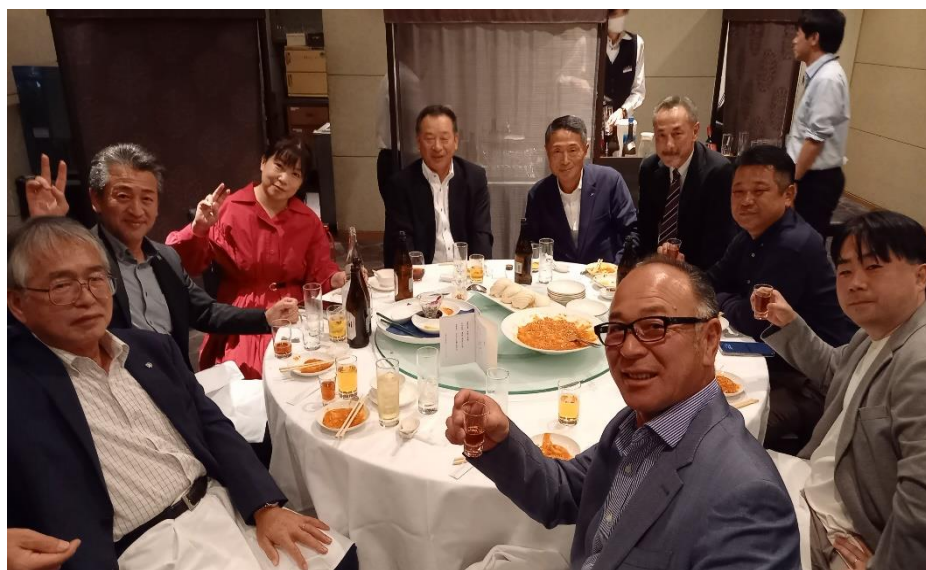
懇談会への当協会の懇談会出席者(他2名は別席)