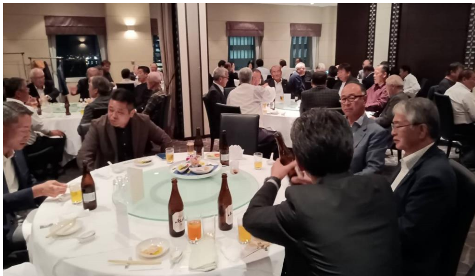
懇談会のほぼ全景(手前が当協会関係者)