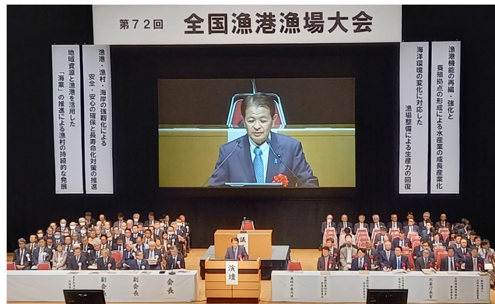
宮下農林水産大臣の祝辞