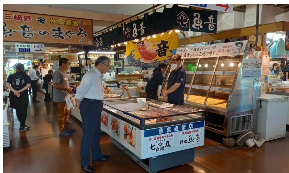
海業関連の「みうらみさき海の駅」の販売所内