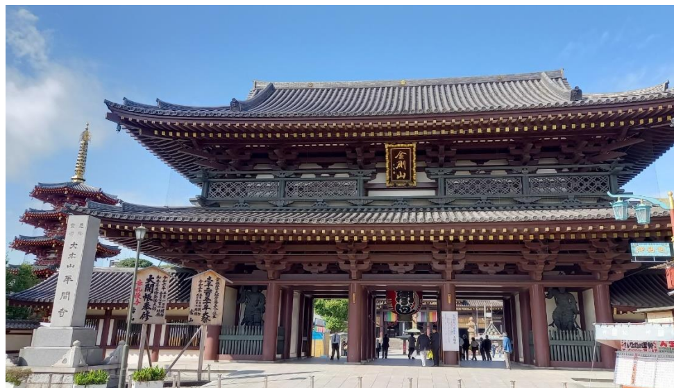
川崎大師で祈願(大山門と八角五重塔)