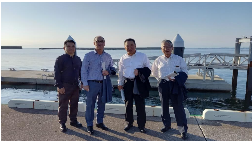
接岸岸壁に設置された観光用等のポンツーン(前列は会員)