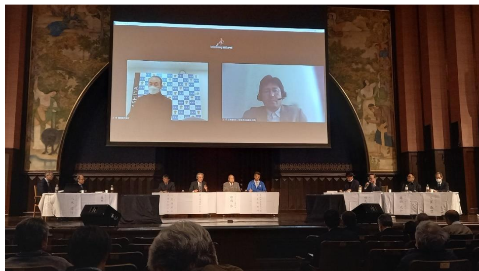
コメンテータと報告者との意見交換