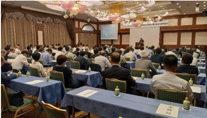
会場の様子(会長挨拶時)