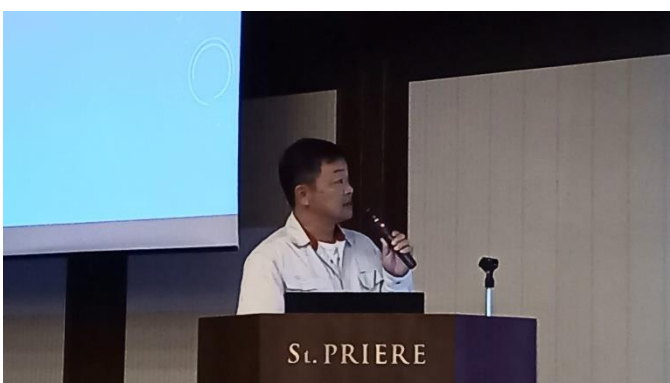
イチケン(株) 小浦部長様の優秀事例発表