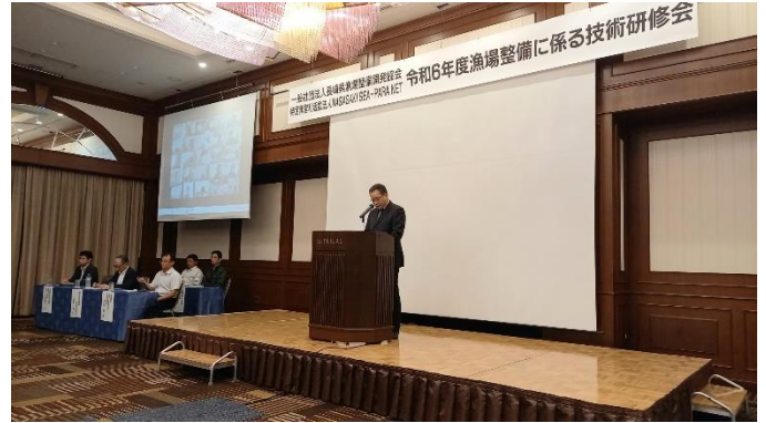
柴田会長挨拶 (左側は5名の講師)