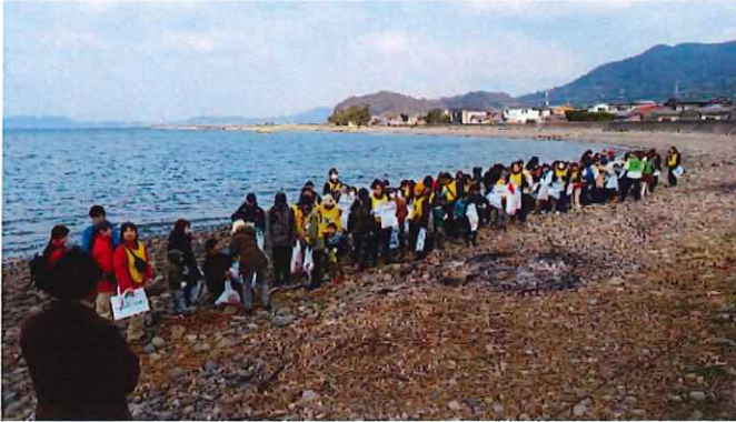
会場(ゴミ拾い)と開会前の状況

【主催】NIB【特別協賛】西海建設【後援】長崎県、東彼杵町【協力】ソーシャルポーツインシアチブ 《開催日時》R7.2.22(土)、9:50~12:10、《開催場所》東彼杵町旧彼杵海水浴場 《参加チーム》 25 (約100名のご参加、来賓・スタッフは別)