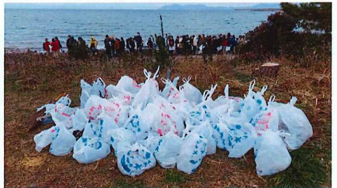
集めたゴミ(燃える・資源等4種に分別)