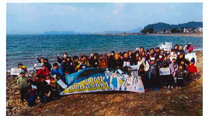
参加者全員で記念撮影