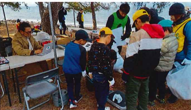
計量(記録:ソーシャルポーツインシアチブ 馬見塚代表)