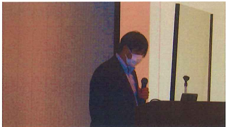
株式会社坂本組 川上課長補佐