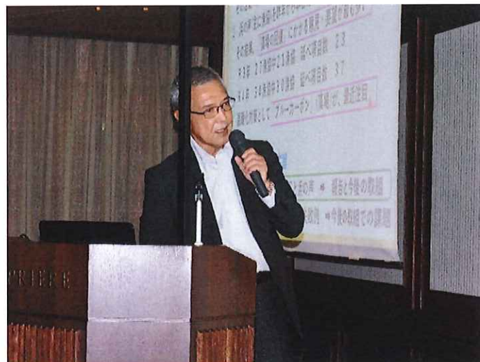
特定非営利活動法人 NAGASAKI SEA-PARA NET 田添理事長